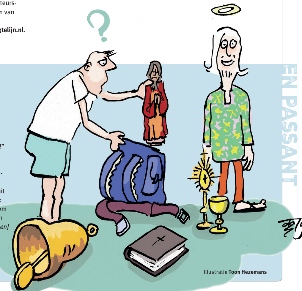
Illustratie Toon Hezemans

Heb je ook een leuk bergverhaal meegemaakt? Mail je anekdote van 120 woorden naar hoogtelijn@nkbv.nl o.v.v. En Passant.